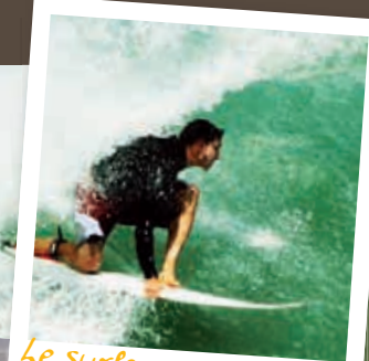
Le surfeur qui dompte les rouleaux

Prêtez votre pull quand elle frissonne et que le soleil se couche, allumez un feu, offrez-lui un verre... Bien joué ! Et... Patatras, il faut absolument que vous vous la jouiez lover à la guitare... Alors, ok vous vous en servez bien, ok vous avez une belle voix, mais laissez tomber votre p#&l de guitare deux secondes et embrassez la fille, là à côté de vous, qui vous fait les yeux doux.