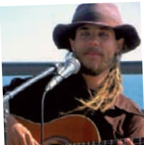
Le mec à la guitare sur la plage

Le chef de file : Ben Harper entre chien et loup