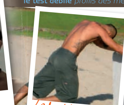
Le bad boy de la plage

Le chef de file : Tom Cruise dans Cocktail