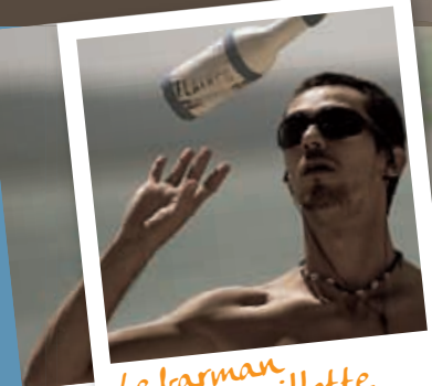
Le barman de la paillotte

Afin d'être totalement transparentes avec les newbies que vous êtes, nous nous devons de porter à votre connaissance le fait que nous avons révélé à notre lectorat féminin les différents profils de ce test. Sachez en tenir compte cet été !